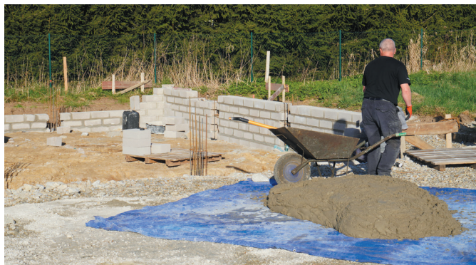
Trwa budowa fundamentów pod świetlicę w Nowym Jaworowie.

To z całą pewnością inwestycja długo wyczekiwana przez mieszkańców Nowego Jaworowa. Dzięki niej zyskają miejsce integracji i aktywności społecznej. Rozpoczęły się prace związane z budową świetlicy wiejskiej. Trwa budowa fundamentów.