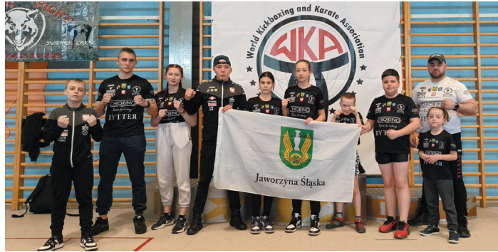
Zawodnicy Fighter Klub Jaworzyna Śląska zaprezentowali się z bardzo dobrej strony, wracając z dziesięcioma medalami.