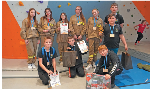
OSP Nowice odebrała nagrodę dla najmłodszej drużyny turnieju.