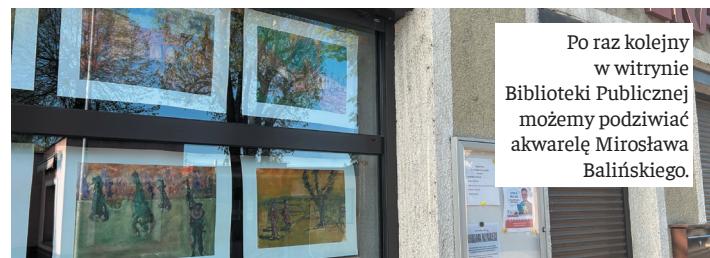
Po raz kolejny w witrynie Biblioteki Publicznej możemy podziwiać akwarelę Mirosława Balińskiego.

niezwykłą wystawę prac Mirosława Balińskiego – mieszkańca Jaworzyny Śląskiej. Akwarele można podziwiać w witrynie biblioteki.