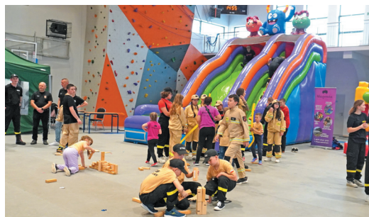
Najmłodsi mieli okazję skorzystać z dmuchańców i innych zabaw kreatywnych, których nie brakowało w tym dniu na hali.