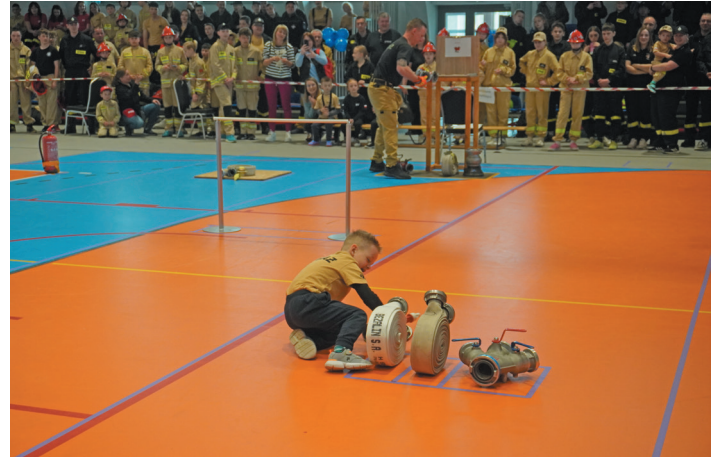
Zawodnicy rywalizowali równocześnie na dwóch torach.