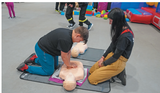
W przerwie między startami można było spróbować swoich sił na fantomach.