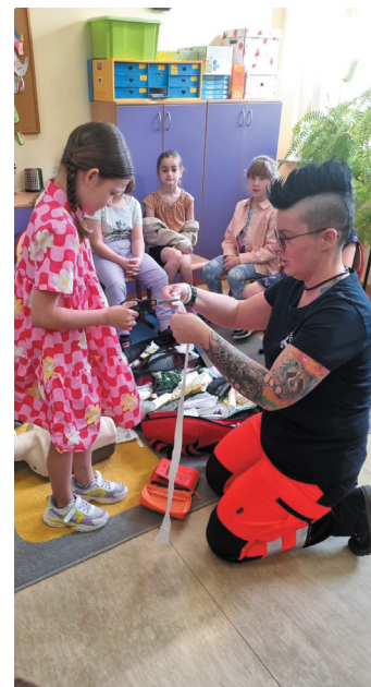
Uczniowie uczyli się m.in., jak prawidłowo wykonać masaż serca.

Spotkanie zorganizowali rodzice jednej z uczennic.