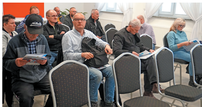
Mieszkańcy gminy licznie wzięli udział w spotkaniu.

Co raz częściej zgłaszane są próby oszustwa bądź nierzetelnie wykonanych usług w ramach programu „Czyste Powietrze”. Dlatego, przystępując do programu, pamiętaj o kilku podstawowych zasadach. Przede wszystkim zaś sprawdzaj oferty, nie podpisuj dokumentów „od ręki”!