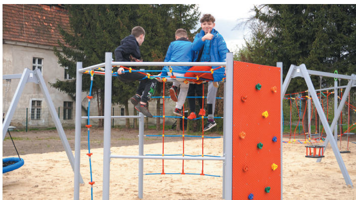
Najmłodszy mieszkańcy sołectwa z radością testowali przygotowane dla nich urządzenia.

pomnijmy, że od 2021 r. mieszkańcy wszystkich miejscowości zyskali nowoczesne i funkcjonalne miejsca rekreacji. – Budowa placu w Bolesławicach okazała się nie lada wyzwaniem. Bardzo długo szukaliśmy odpowiedniej działki i dzisiaj spotykamy się tutaj, co mnie bardzo cieszy. Oddajemy do użytku plac ogrodzony, z zamontowanym energooszczędnym oświetleniem i monitoringiem. Sprzęt jest dobrany tak, że każdy znajdzie coś dla siebie,