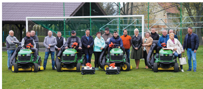
Prezesi klubów z naszej gminy odebrali kosiarki 2 kwietnia.

W ramach tego samego zadania jeszcze w tym roku odbędzie się remont szatni sportowych przy boisku w Piotrowicach Świdnickich. Inwestycję realizuje Przedsiębiorstwo Kształowania Zieleni Piotr Szuman z Jaworzyny Śląskiej. Koszt zakupu kosiarek i remontu to 297 tys. zł. Zadanie dofinansowano z Rządowego Funduszu Polski Ład: Program Inwestycji Strategicznych.