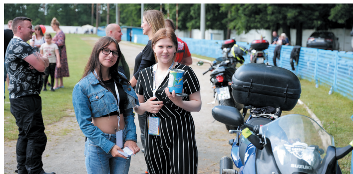
Po raz kolejny sztab ludzi pracował na sukces pikniku charytatywnego. Dzięki temu zebrano dwukrotnie więcej niż w 2022 r.

Pokazy militarne, konkursy, licytacje charytatywne i mnóstwo dobrej zabawy – za nami Charytatywny Piknik Jaworzyńskiej Pozytywki. Po raz kolejny mieszkańcy gminy otworzyli serca i portfele. Zebrano ponad 8 tys. złotych.