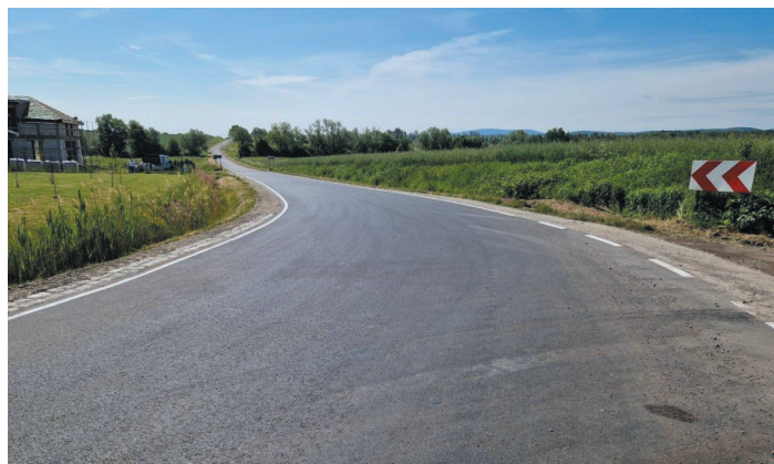
Zakończył się remont drogi powiatowej w Milikowicach.

Zakres wykonanych prac obejmował między innymi: frezowanie i rozebranie istniejącej nawierzchni, wykonanie warstwy ścieralnej z mieszanki mineralno-bitumicznej, wykonanie poboczy, regulację pionową studzienek. Długość remontowanego odcinka wyniosła 880 mb. Koszt prac to ponad 406 tys. zł, środki w całości pochodziły z budżetu powiatu świdnickiego.