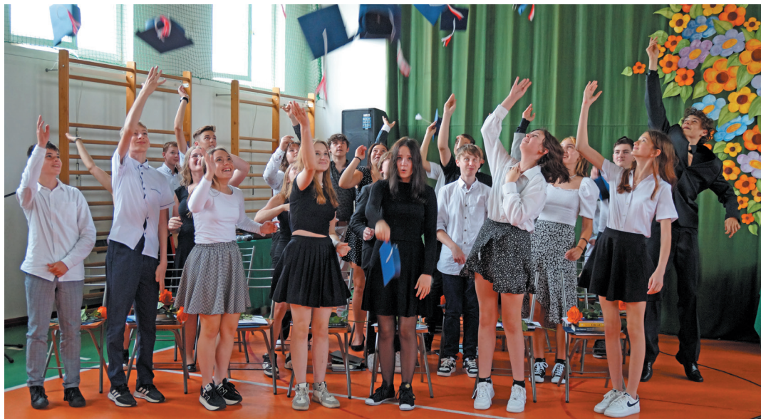
Uczniowie klas ósmych uroczysto zakończyli rok szkolny (na zdj. uczniowie Szkoły Podstawowej w Starym Jaworowie).

Po 10 miesiącach nauki nie tylko nadszedł czas na upragnione wakacje, ale też nagrodzenie tych, którzy w roku szkolnym 2022/2023 osiągnęli najlepsze wyniki w nauce. 143 osoby otrzymały świadectwa z czerwonym paskiem. Absolwenci klas ósmych, którzy osiągnęli średnią powyżej 5,0, otrzymają jednorazowe stypendium w wysokości 1000 zł.