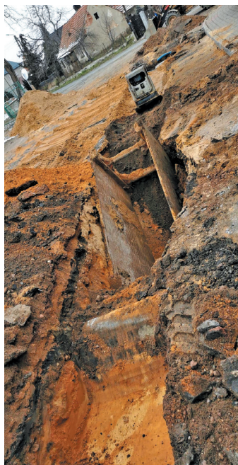
W 2022 r. zakończono budowę prawie 7,5 km sieci kanalizacji sanitarnej w Pastuchowie.

nie jej mętności. - W okresie 25-letniej eksploatacji studnia nie była poddawana żadnym badaniom i zabiegom regeneracji z powodu braku środków finansowych na ten cel. Wobec powyższego jej wydajność, mierzona podczas inspekcji przeprowadzonej we wrześniu ubiegłego roku, wynosiła tylko 41,40 % wartości jej wydajności w początkowym okresie jej eksploatacji. Przeprowadzenie zabiegu jej regeneracji okazało się konieczne, gdyż odwlekanie go w czasie spowodowałoby dalszy spadek wydajności lub uszkodzenie studni skutkujące zaprzestaniem jej eksploatacji. Podjęcie działań związanych z jej płukaniem oraz płukaniem filtrów znajdujących się w budynku SUW pozwoliło na znaczne obniżenie mętności wody – wyjaśnia Łukasz Kwadrans . – Przepraszamy mieszkańców za istniałe niedogodności.