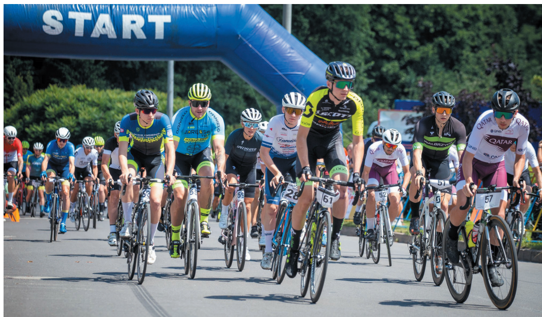
W ubiegłym roku po raz pierwszy kolarze startowali wspólnie z Jaworzyny Śląskiej.

Tegoroczna edycja odbędzie się w dniach od 1 do 2 lipca. W sobotę, 1 lipca zawodnicy pojedą w doskonale znanej jeździe indywidualnej na czas. Start i meta zlokalizowane zostaną w Nowicach, a trasa przebiegać będzie przez Piotrowice Świdnickie, Nowice, Bolesławice, Jaworzynę Śląską. Do pokonania będzie maks. 13 km. W niedzielę, 2 lipca zawodnicy wystartują wspólnie i będą musieli kilkakrotnie pokonać 10-kilometrowy odcinek na trasie Jaworzyna Śląska – Czechy – Pastuchów – Piotrowice Świdnickie – Jaworzyna Śląska. Start i meta zlokalizowane będą na terenie Przedszkola Samorządowego „Chatka Puchatka” w Jaworzynie Śląskiej.