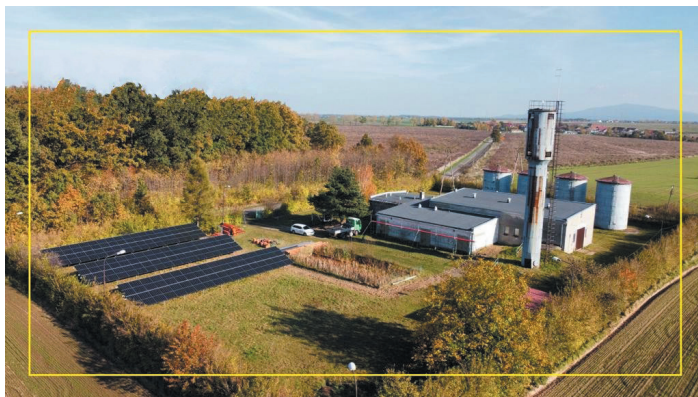
Cały czas trwają inwestycje w poprawę i ochronę wody pitnej. Zmodernizowano m.in. budynek Stacji Uzdatniania Wody i zamontowano instalację fotowoltaiczną.

Niewątpliwie do najważniejszych inwestycji zrealizowanych w ostatnich latach należy budowa kanalizacji sanitarnej w Piotrowicach Świdnickich w 2018 r. Wybudowano 4,98 km sieci oraz uruchomiono tłocznię ścieków. Wartość inwestycji wyniosła 5,6 miliona złotych. W tym samym czasie zmodernizowano Stację Uzdatniania Wody – m.in. zmieniono system napowietrzania, wymieniono filtry, wprowadzono system monitorowania prowadzonych procesów. Modernizacja wyniosła 1,8 miliona złotych. W 2022 r. zakończono budowę prawie 7,5 km sieci kanalizacji sanitarnej w Pastuchowie wraz z odcinkami bocznymi do posesji i uruchomiono tłocznię ścieków. Całość kosztowała 7,3 miliona złotych. W ramach oszczędności, jakie udało się pozyskać w postępowaniach przetargowych, wybudowano dodatkowo 3,47 km sieci kanalizacji sanitarnej w północnej części Jaworzyny Śląskiej. Inwestycja kosztowała 3,1 miliona złotych. Na realizację zadań ZUK pozyskał