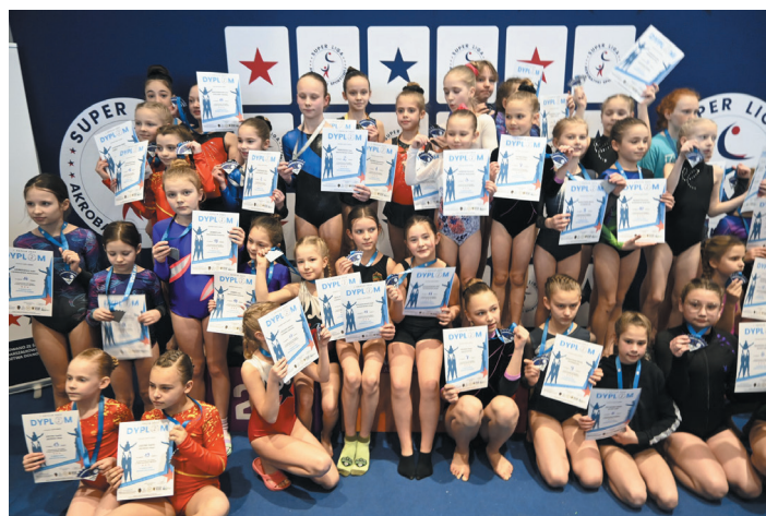
W turnieju wzięło udział prawie 400 zawodników z 17 dolnośląskich klubów.

Szczegółowe wyniki dostępne na stronie: https://online.itsport.pl/