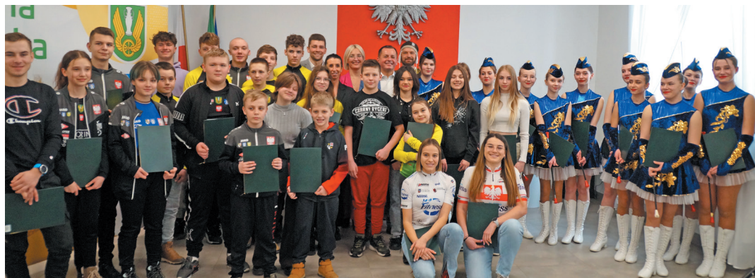
45 młodych sportowców i artystów z naszej gminy odebrało stypendia burmistrza Jaworzyny Śląskiej.