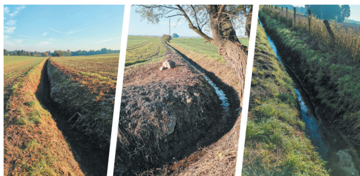
Spółka Wodna zajmuje się bieżącą konserwacją i utrzymaniem rowów melioracyjnych i przepustów - bez względu na ich własność.

1 i 2 marca odbyły się 4 zebrania z zainteresowanymi właścicielami gruntów dotyczące dalszego funkcjonowania Spółki Wodnej – w Piotrowicach Świdnickich, Czechach, Starym Jaworowie i Nowicach. Uczestniczyło w nich około 50 osób. Na spotkaniach omówiono zagadnienia dotyczące melioracji, ale też problemy, z ja-