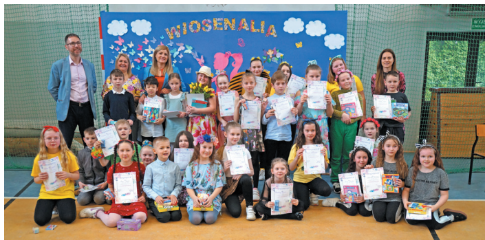
27 uczniów najmłodszych klas zaprezentowało swoje talenty podczas 25. edycji „Wiosenaliów”.

i pasje podczas „Wiosenaliów”, jakie po raz 25. odbyły się w Szkole Podstawowej w Jaworzynie Śląskiej.