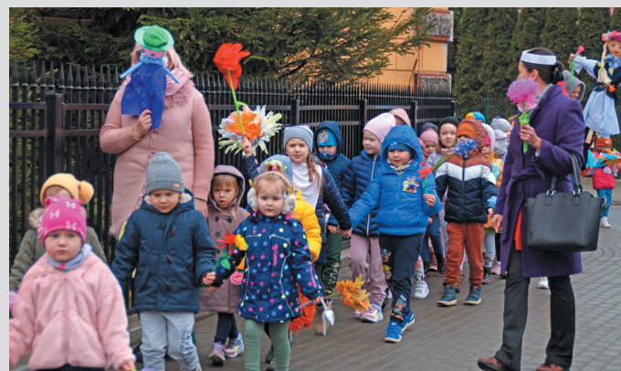
Zaopatrzone w kwiaty z bibuły oraz przygotowane wcześniej marzanny przedszkolaki z Przedszkola Samorządowego „Chatka Puchatka” wyruszyli 21 marca na ulice Jaworzyny Śląskiej, aby pożegnać zimę i powitać wiosnę. Podczas spaceru głośno przywoływały wiosnę, a na zakończenie pod budynkiem przedszkola odśpiewały jeszcze piosenki na cześć wiosny.