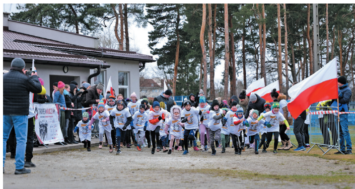
Ponad stu biegaczy stawiła się na starcie tegorocznej edycji wydarzenia.

Przypomnijmy, w 2011 r. dzień 1 marca został ustanowiony świętem państwowym – Narodowym Dniem Pamięci „Żołnierzy Wyklętych”. Jest to święto, honorujące i upamiętniające żołnierzy polskiego podziemia antykomunistycznego i antysowieckiego działającego w latach 1944 – 1963 w obrębie przedwojennych granic RP.