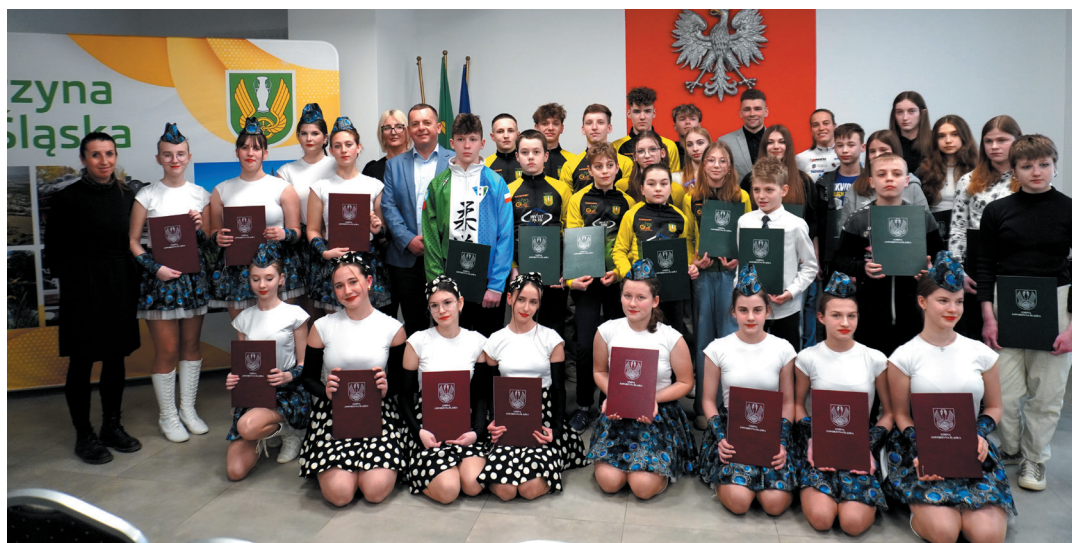
40 młodych mieszkańców gminy Jaworzyna Śląska odebrało stypendia sportowe i artystyczne.

Uroczyste wręczenie stypendiów odbyło się w czwartek, 14 marca w Urzędzie Stanu Cywilnego w Jaworzynie Śląskiej. – Gratulujemy wam, to są efekty waszej ciężkiej pracy, starań i wyrzeczeń. Dziękujemy za godne reprezentowanie naszej gminy oraz waszych klubów sportowych. Dziękujemy również waszym trenerom, działaczom oraz rodzicom, bez wsparcia których te sukcesy nie byłyby możliwe. Życzymy wytrwałości oraz