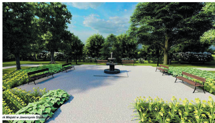
Tak będzie wyglądał park po remoncie.

wane zostaną elementy małej architektury oraz oświetlenia. Powstaną nowe ścieżki, a fontanna zostanie odnowiona. Koszt prac to 999 854,70 zł. Planowany termin ich zakończenia to czerwiec 2024 r. Zadanie dofinansowano z Rządowego Funduszu Polski Ład: Program Inwestycji Strategicznych.