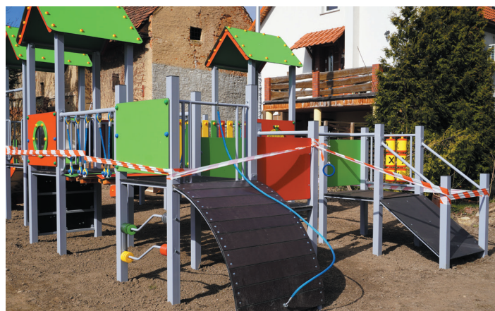
Budowa placu zakończy się w kwietniu.

Budowa została dofinansowana z Rządowego Funduszu Polski Ład: Program Inwestycji Strategicznych.