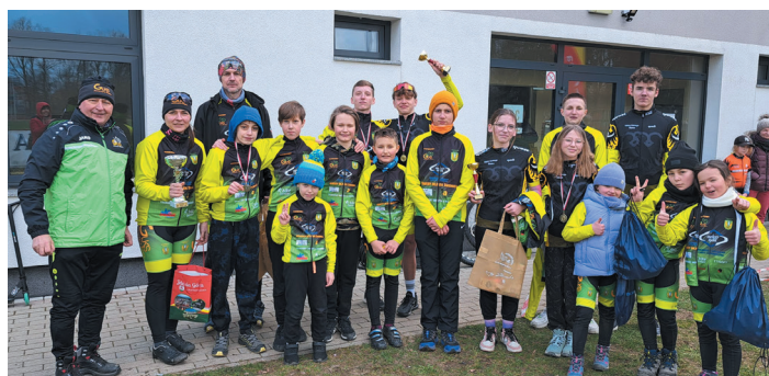
Zawodnicy z sekcji kolarskiej GLKS w Jaworzynie Śląskiej nie mieli sobie równych podczas Otwartych Mistrzostw Dolnego Śląska w kolarstwie przełajowym.

łajowym X Puchar Quest Sport XX Memoriał Jana Kozłowskiego odbyły się w sobotę, 9 marca w Cieplicach-Zdrój w Jeleniej Górze. Kolarze Gminnego Ludowego Klubu Sportowego w Jaworzynie Śląskiej czternaście razy stawali na podium, zdobyli osiem medali i pięć koszulek. Na technicznej trasie o 2,5 km rundzie zdeklasowali rywali.