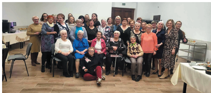
Mieszkanke Pasiecznej świętowały w nowo wyremontowanej świetlicy wiejskiej.