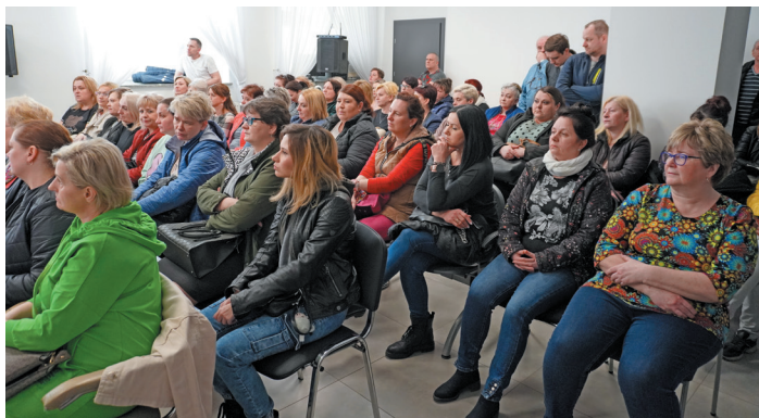
Ponad sto osób wzięło udział w spotkaniu z przedstawicielami ZUS i PUP w Świdnicy.

Spotkanie odbyło się w piątek, 15 marca w sali konfe-