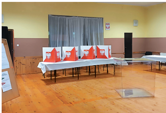
7 kwietnia mieszkańcy naszej gminy ruszą do lokali wyborczych.

W niedzielę, 7 kwietnia odbędą się wybory samorządowe. Będziemy nie tylko wybierać burmistrza i radnych miejskich, ale też naszych przedstawicieli w samorządach powiatu i województwa. Podpowiadamy, gdzie w naszej gminie, zgodnie z decyzją komisarza wyborczego, znajdują się okręgi wyborcze oraz listy kandydatów na burmistrza i radnych miejskich.