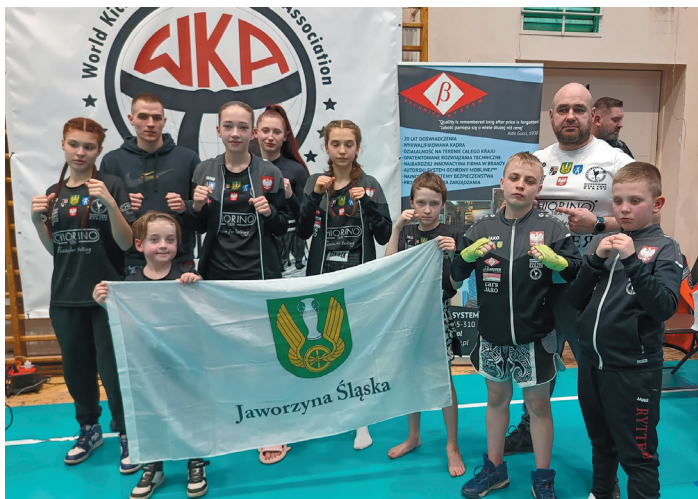
Zawodnicy Fighter Klub Jaworzyna Śląska z sukcesami zaprezentowali się podczas Otwartych Mistrzostw Polski WKA 10 marca.