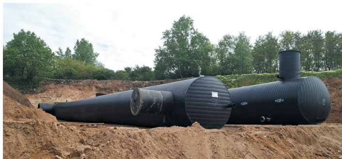
Prowadzone na terenie strefy przemysłowej prace inwestycyjne nie były związane z "Wytwornią Ziemi Organicznej", a są inwestycją gminy w zakresie budowy dróg, kanalizacji deszczowej.

Jednocześnie dyskusja wokół inwestycji zwróciła uwagę na szerszy problem związany z gospodarowaniem odpadami BIO, który dotyczy dziś praktycznie wszystkich samorządów w Polsce. Dlatego tak ważne są zarówno odpowiedzialne działania samorządu, jak i świadome podejście mieszkańców do gospodarki odpadami oraz rozwoju gminy.