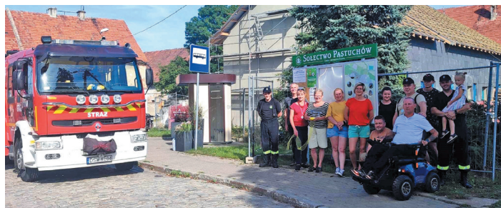
W ramach realizacji zadania w 2023 r. uporządkowano teren przy przystanku i zamontowano nową tablicę informacyjną.

Montaż witaczy, konkurs i spotkanie integracyjne – to część działań, jakie jeszcze w tym roku planują mieszkańcy Pastuchowa. Sołectwo pozyskało na ten cel 11 tys. 400 zł dofinansowania z Urzędu Marszałkowskiego.