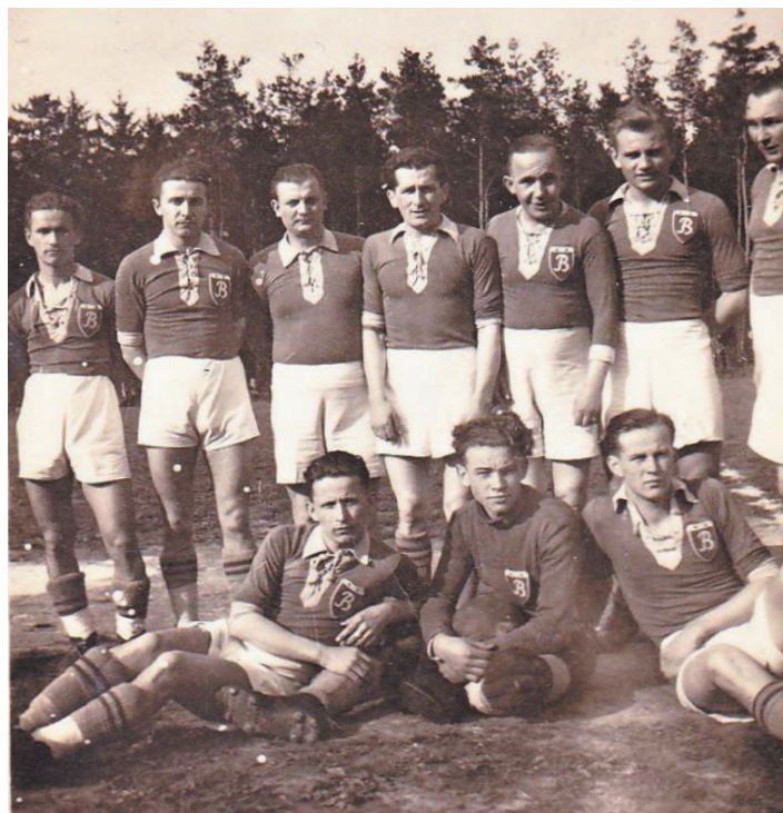
Drużyna KS Budowlani swój pierwszy mecz rozegrała 12 marca 1950 roku. (foto z 1948 r.)