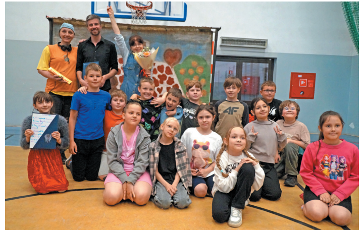
22 maja najmłodszych uczniów zaproszono na spektakl „Jaś i Małgosia”.

Zarówno warsztaty, jak i spektakl zorganizowano w ramach projektu „Bliżej teatru” realizowanego przez Teatr William-Es w szkole w Jaworzynie Śląskiej. Jest on dofinansowany ze środków budżetu samorządu województwa dolnośląskiego.