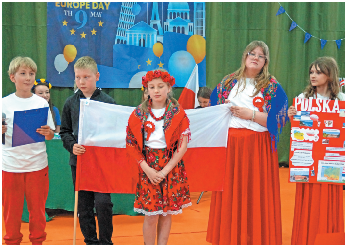
Uczniowie poszczególnych klas przygotowali prezentacje wybranych krajów unii. Nie mogło wśród nich zabraknąć Polski.

Poznanie europejskich kultur, konkursy, integracja i mnóstwo dobrej zabawy – pod takimi hasłami w piątek, 15 maja w Szkole Podstawowej z Oddziałami Integracyjnymi w Starym