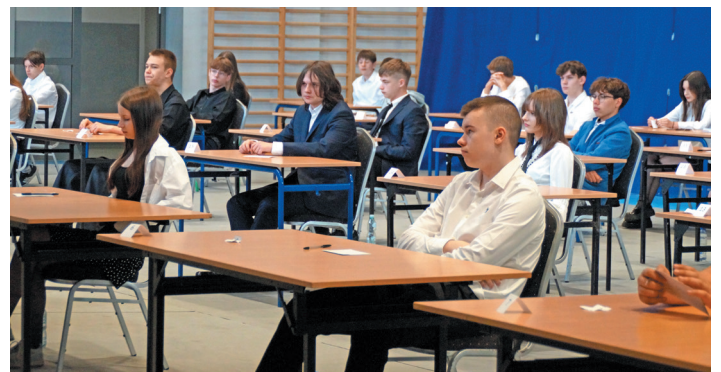
Uczniowie przez trzy dni mierzyli się z egzaminem ósmoklasistów. Na zdj. młodzież ze Szkoły Podstawowej w Jaworzynie Śląskiej.

11 maja pisali test z języka polskiego. We wtorek, 12 maja - matematykę, 13 maja - język obcy. Wyniki zostaną opublikowane na stronie Centralnej Komisji Edukacyjnej 3 lipca, w tym samym dniu uczniowie będą mogli odebrać zaświadczenia ze szkół. Trzymamy kciuki za jak najlepsze wyniki i życzymy powodzenia w rekrutacji na wymarzone kierunki.