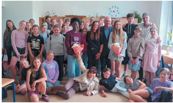
6 maja uczniowie klas 4-8 wzięli udział w warsztatach teatralnych i zaskoczyli prowadzących pomysłowością.