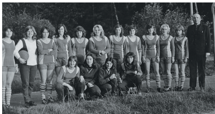
Żeńska drużyna piłkarska „Karolinki” dostarczała mnóstwo emocji.