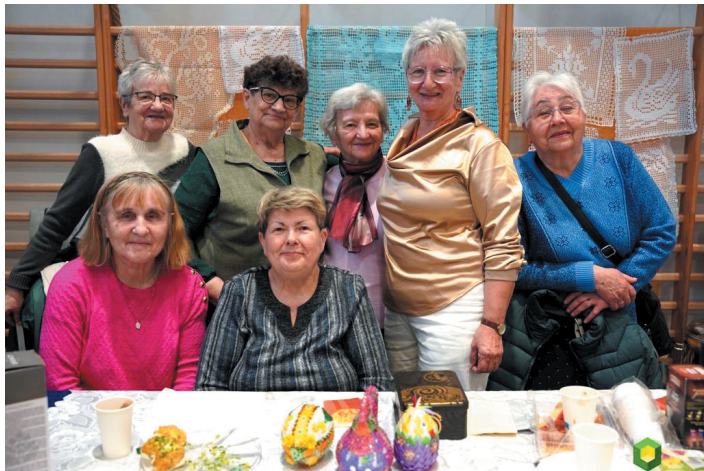
Wystawcy nie zawiedli i przygotowali liczne stoiska. Swoje rękodzieło zaprezentowali także jaworzyńscy seniorzy.

Kiermasz lokalnych producentów, wręczenie nagród w konkursach plastycznych, występy artystyczne – te i wiele innych atrakcji czekało na uczestników Jarmarku Wielkanocnego, jaki odbył się w Niedzielę Palmową, 29 mar-