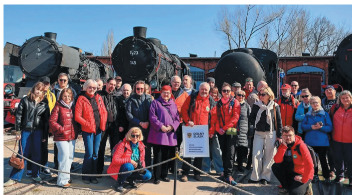
11 kwietnia w Muzeum Kolejnictwa gościło ponad 50 przewodników z Polskiego Towarzystwa Turystyczno-Krajobrazowego.

Zwiedzanie pociągiem jest nie tylko możliwe, ale też wygodne, co udowodnili uczestnicy sympozjum poświęconego kolejnictwu na Dolnym Śląsku. Na ich trasie nie zabrakło Muzeum Kolejnictwa w Jaworzynie Śląskiej – 11 kwietnia gościło w nim ponad 50 przewodników z Polskiego Towarzystwa Turystyczno-Krajobrazowego.