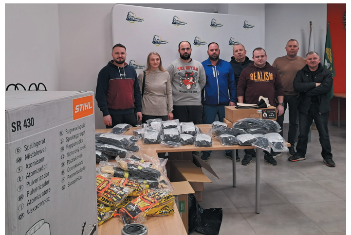
Przedstawiciele ochotniczych straży pożarnych odebrali zakupiony sprzęt.

w ramach programu „Sprzęt dla OSP” (dawniej „Mały Strażak”) w 2025 roku wszystkim zakwalifikowanym gminom przekazał 30 tys. złotych na zakup sprzętu i wyposażenia dla jednostek ochotniczych straży pożarnych w województwie dolnośląskim. Za otrzymane dofinansowanie zakupiono m.in. rękawice strażackie, buty, wentylator, opryskiwacz spalinowy i deszczownicę.