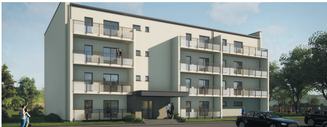
W budowanym obiekcie znajdzie się 30 mieszkań.

W ramach inwestycji przy ul. Ekerta powstanie czterokondygnacyjny budynek i 30 mieszkań – 27 dwupokojowych i 3 trzypokojowe o metrażu od 28 do 65 m 2 . Budynek zostanie wyposażony