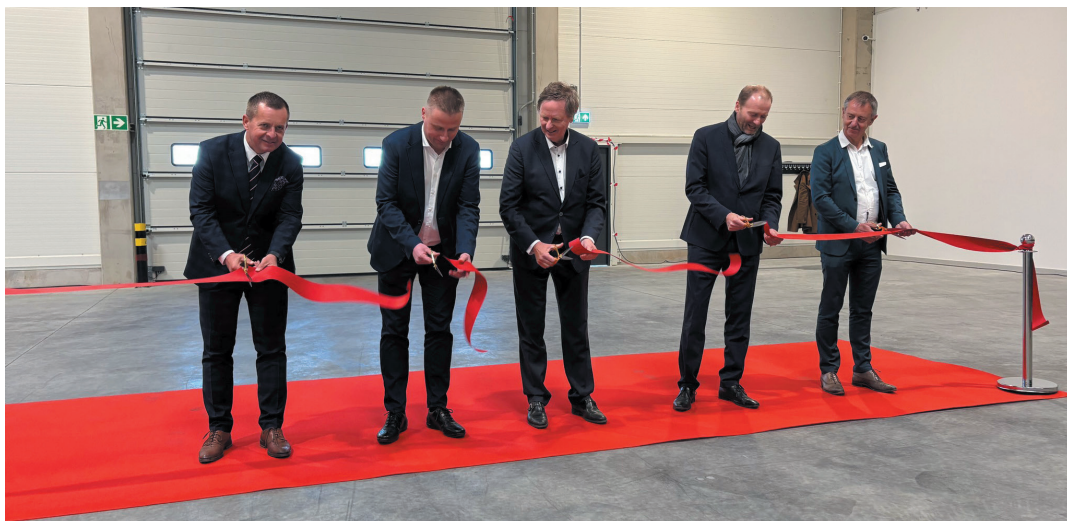
Uroczyste przecięcie wstęgi odbyło się 9 kwietnia.

Rector Polska zakończył budowę trzeciego zakładu produkcyjnego w Jaworzynie Śląskiej. Produkcja ruszyła pod koniec 2025 r., natomiast w czwartek, 9 kwietnia odbyło się uroczyste otwarcie.