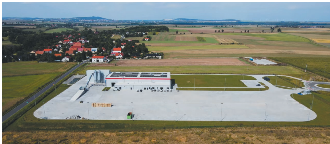
Zakład wraz z zapleczem biurowo-magazynowym powstał na działce o powierzchni 6 ha. Produkcja już trwa.

W Jaworzynie Śląskiej powstała hala z linią produkcyjną prefabrykowanych elementów betonowych wraz z infrastrukturą towarzyszącą. Hala została tak zaprojektowana, aby w przyszłości była możliwość jej rozbudowy o część produkcyjną belek sprężonych lub innych elementów prefabrykowanych. Powstał również plac magazynowy wyrobów gotowych oraz magazyn zamknięty, drogi wewnętrzne, biurowiec wraz z salą konferencyjną. - Jaworzyńska Strefa Prze-