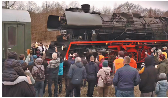
Przejazd pociągu Rübezahl przyciągnął do Muzeum Kolejnictwa tłumy.

Rübezahl to po polsku „Liczyrzepa” – nazwa dobrze znana wszystkim, którzy kojarzą legen-