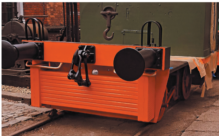
Prace renowacyjne lokomotywy Deutz OMZ 117R są na ukończeniu.

pracownicy Muzeum Kolejnictwa w Jaworzynie Śląskiej.